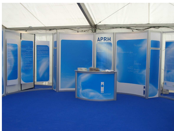
8.º Congresso da Água, Março 2006