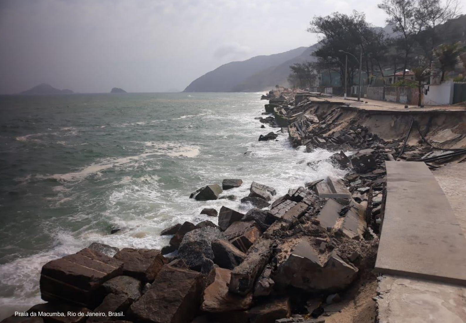
Praia da Macumba, Rio de Janeiro, Brasil.