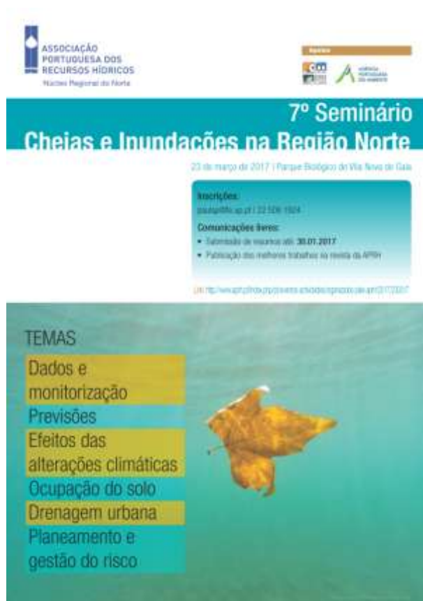
Figura I-2: 7º Seminário da APRH-Norte – “Cheias e Inundações na Região Norte”, no auditório do Parque Biológico de Vila Nova de Gaia

No que respeita à atividade corrente do Núcleo, realizaram-se quatro reuniões no Porto, na FEUP, a 6 de fevereiro 22 de junho; 17 de julho e 20 de setembro de 2017 dos órgãos sociais, para definição e preparação de atividades em curso, bem como distribuição de tarefas pelos vários membros. Outros contatos foram estabelecidos por Skype e email.