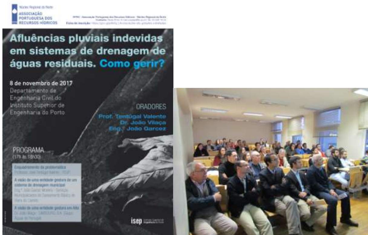
Figura I-1: Conversas de Fim de tarde no Auditório do ISEP

Ponto 6. Foi organizada a sessão “Conversas de Fim de Tarde – Afluências Pluviais Indevidas em Sistemas de Drenagem de Águas Residuais”, em conjunto com o Departamento de Engenharia Civil do ISEP, que teve lugar naquela instituição de ensino, no passado dia 8 de novembro de 2017, tendo sido possível a participação de 3 oradores convidados. O evento contou com cerca de 50 participantes (Figura II-1).