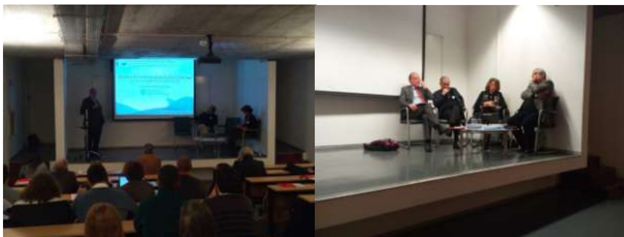
Figura I-6: VI Jornadas dos Recursos Hídricos.

O Núcleo Regional do Sul da APRH esteve particularmente ativo no apoio à Organização do 14º Congresso da água a realizar em Évora de 7 a 10 de março de 2018.