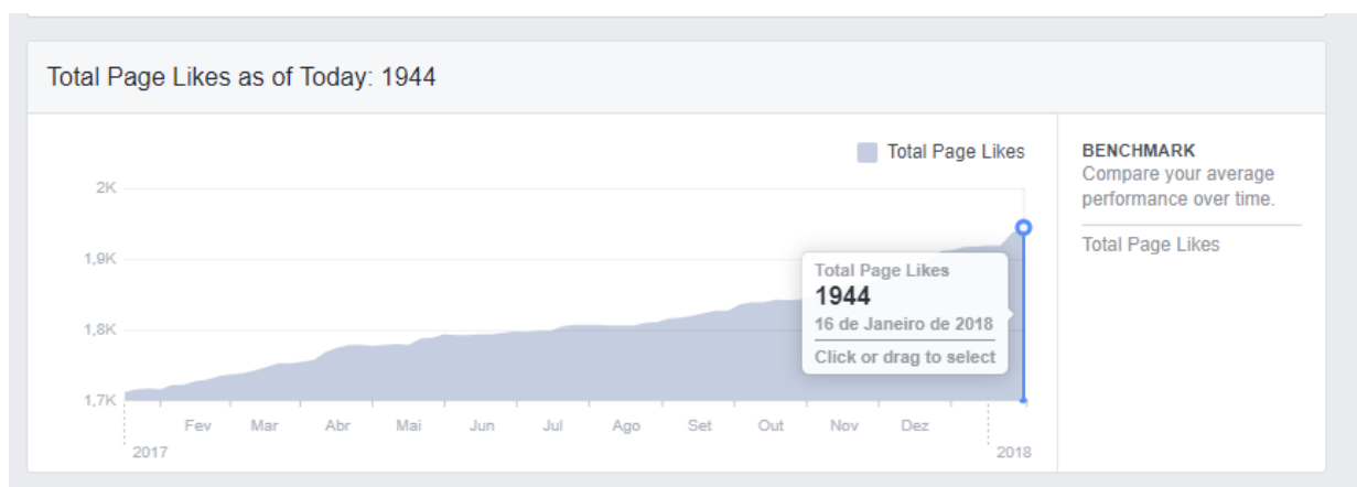
Figura 3 – Evolução do número de seguidores no Facebook.

O endereço é: https://www.facebook.com/Associação-Portuguesa-dos-Recursos-Hídricos .