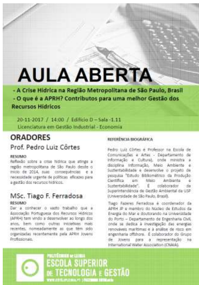
Figura I-5: Palestra no Instituto Politécnico da Guarda.

Os Conselhos de Região Hidrográfica são órgãos de consulta e apoio da Agência Portuguesa do Ambiente, em matéria de recursos hídricos para as respetivas regiões hidrográficas. A direção da APRH-Centro esteve, em representação da APRH, nas reuniões do Conselho de Região Hidrográfica do Centro que decorreram nos dias 15 de fevereiro 2017 em Coimbra, 21 de junho de 2017 na Batalha e 25 de outubro de 2017 em Aveiro.