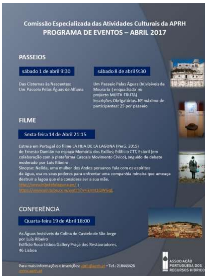
Figura 5 - Eventos realizados em 2017.