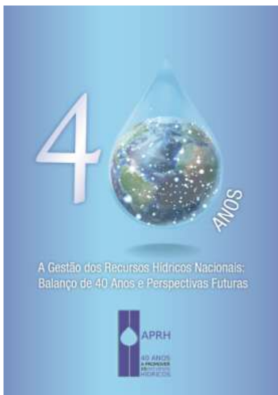
Figura 6 - Livro comemorativo dos 40 anos da APRH.

Publicação comemorativa dos 40 anos da APRH, Figura 6.