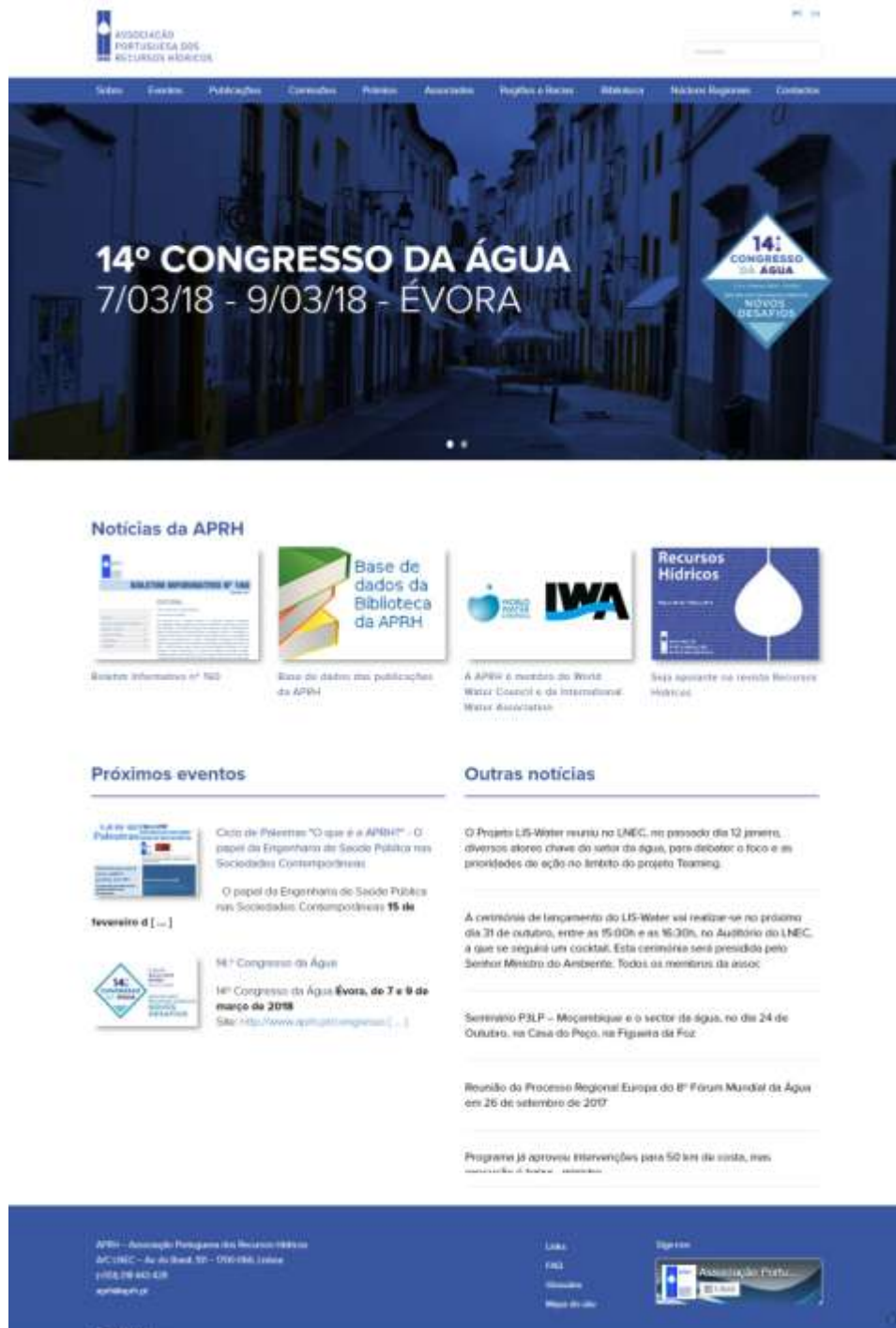
Figura 4 – Nova Página da APRH.

A APRH tem uma nova página, com o layout mais atual e mais funcional. A página foi lançada no final do mês de janeiro de 2018, Figura 4.